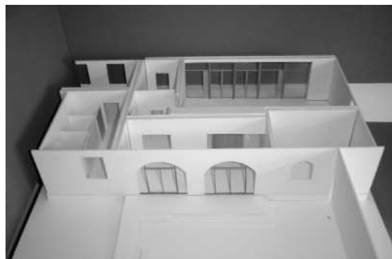
Das Modell unseres neuen Gemeindesaals Foto: Weiler & Köhle

Die Vorbereitungen zur Renovierung unseres Gemeindesaals schreiten gut voran. Mitte Oktober präsentierten die beiden beauftragten Architektinnen Christine Köhle und Barbara Weiler im Rahmen einer öffentlichen Sitzung dem Kirchengemeinderat ihr Umbaukonzept. Das Gremium stimmte dem Plan zu und verständigte sich auf das Ziel, die Finanzierung noch in diesem Jahr zu prüfen.