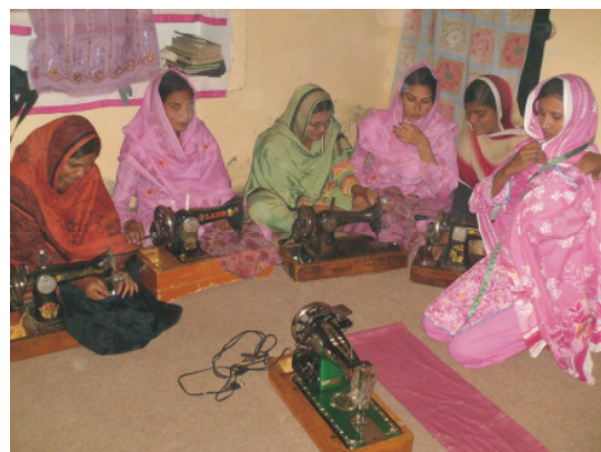
Nähkurs für Frauen